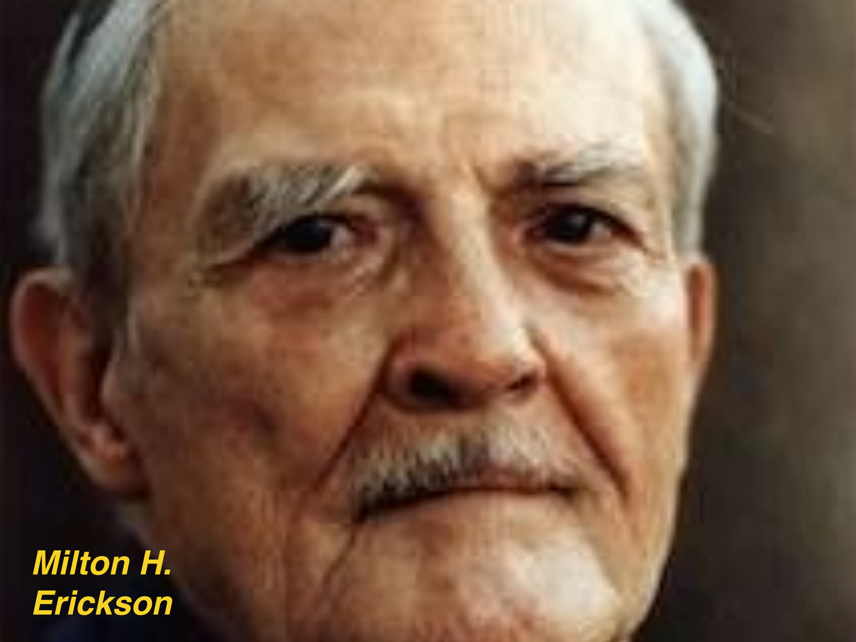
Milton H. Erickson