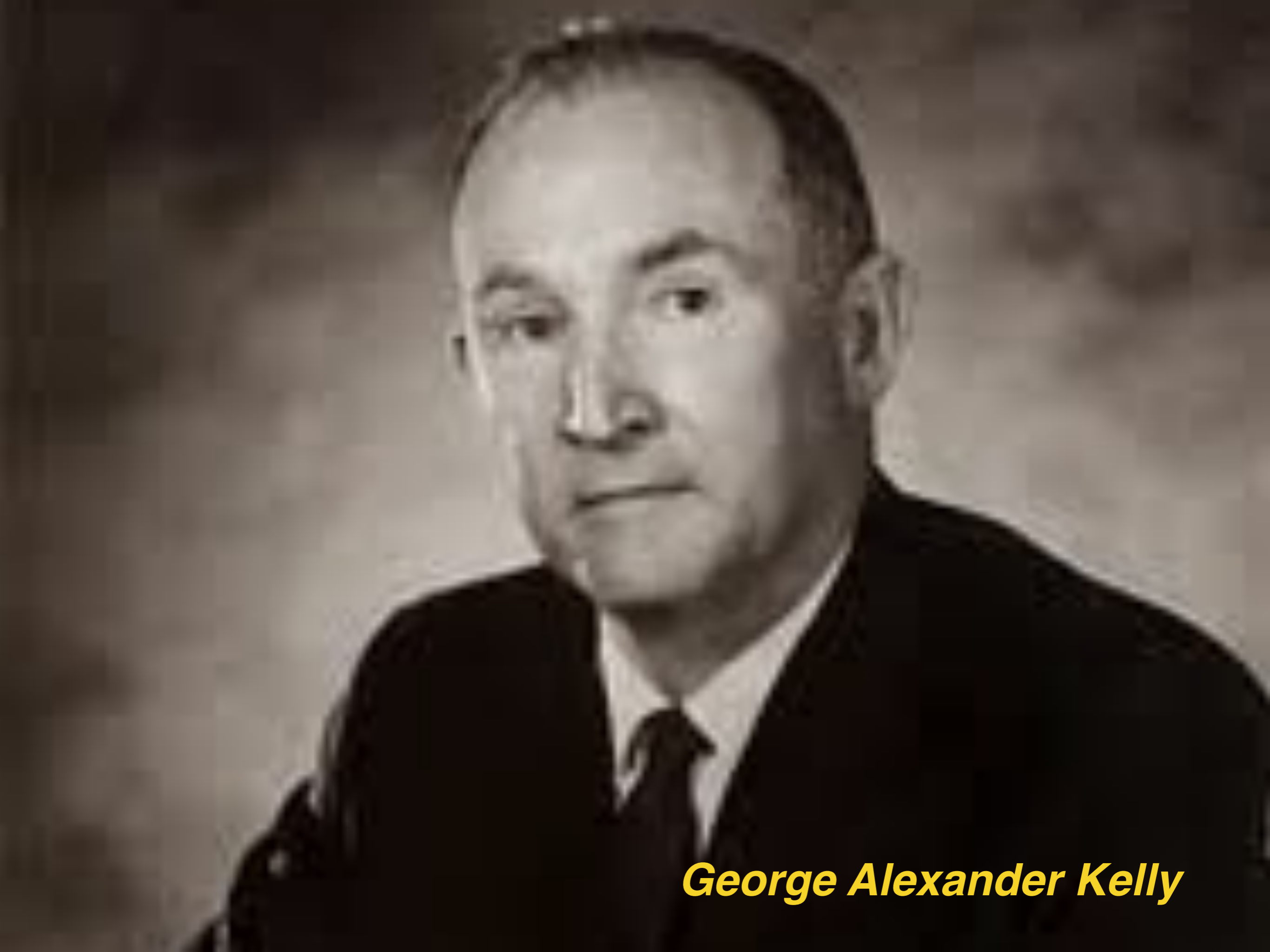
George Alexander Kelly